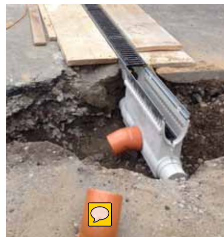
Napojení žlabu MEARIN