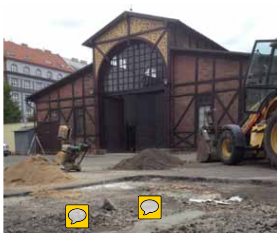
Instalace žlabu MEARIN