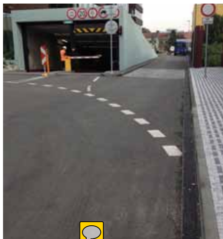
Žlab MEARIN u vjezdu do garáží