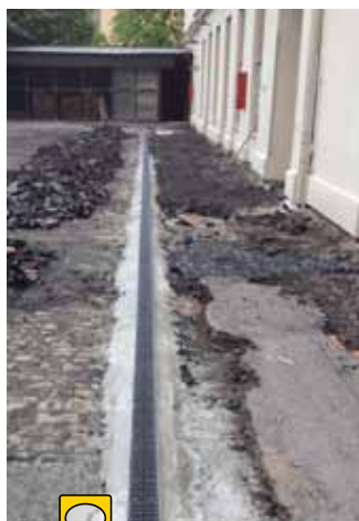
Aplikace žlabu MEARIN

V případech vysoké zátěže se používají již litinové rošty. Speciálně pro městskou aglomeraci byly vyvinuty